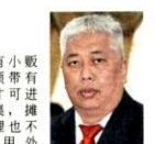
士拉央市议员深恩

士拉央市议会今年也拒绝了5个高戒月市集的地点, 包括Jalan T1B 1A的泊车场, 士拉央高街1A路, 士拉央珍珠花园(Taman Selayang Mutiara), Jalan Rawang Idaman 1和Jalan Rawang Integrated。