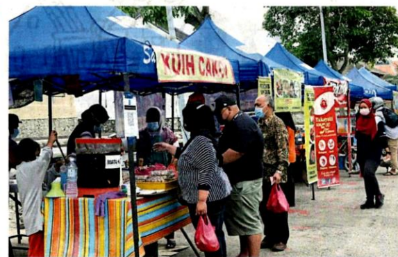
高戒月市集以往人挤人的热闹情况已不再, 所有人都必须保持身距离防疫。

“八打灵再也市政厅今年也推出“得来速”(Drive Thru)的高戒月市集, 主要落在地方