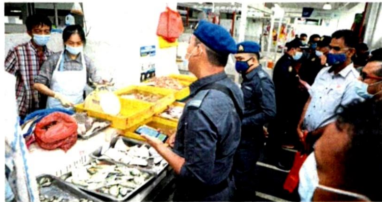
MBSA officers checking on traders during the joint operation at Pasar Moden Sri Muda.

MBSA reminded market traders and visitors to comply with the