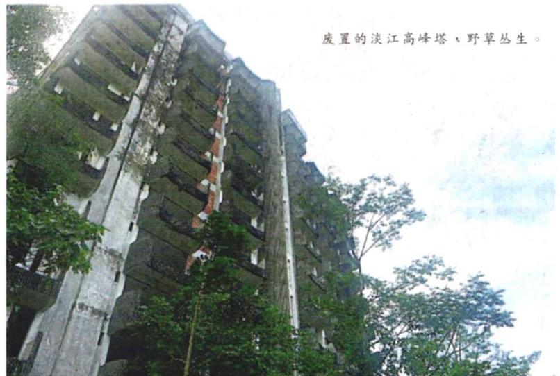
废置的淡江高峰塔，野草丛生。