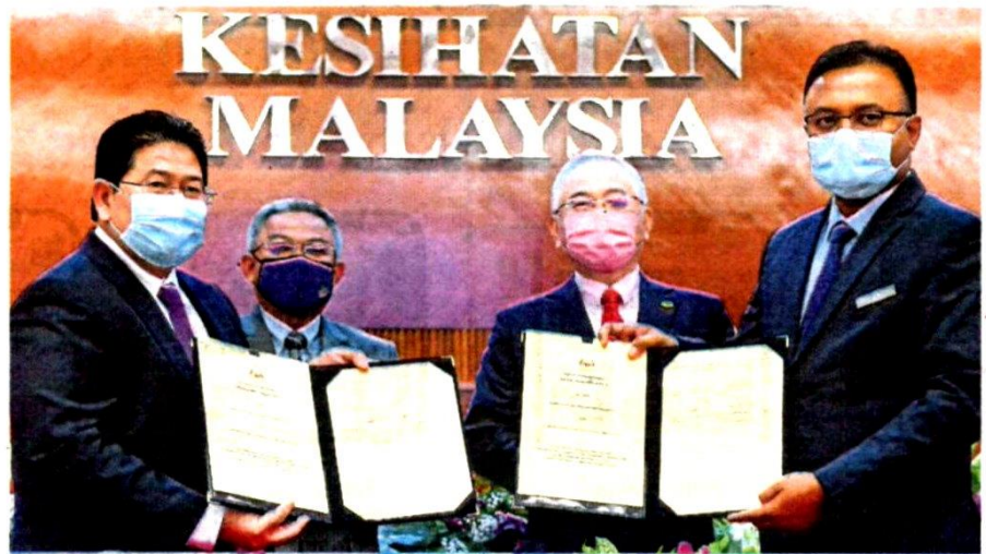
DR Adham (dua dari kiri) dan Wee (dua dari kanan) menyaksikan Majlis Tandatangani Nota Kerajaan antara Kementerian Kesihatan (KKM) dan Kementerian Pengangkutan, semalam.