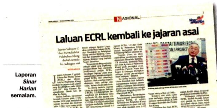
Laporan Sinar Harian semalam.

Ia bakal menarik 5.03 juta penumpang dan membawa 26.12 juta tan kargo pada tahun pertama operasi.