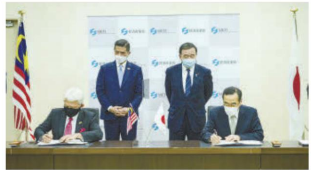
The MoC signing, witnessed by Azmin and Japan's Minister of Economy, Trade and Industry Hiroshi Kajiyama, signifies both organisations' commitment to strengthen bilateral trade relations between Malaysia and Japan.

Through the MoC, Matrade, an agency under Ministry of International Trade & Industry, looks forward to intensify collaboration with Jetro in the long-run by capitalising the opportunities in the current