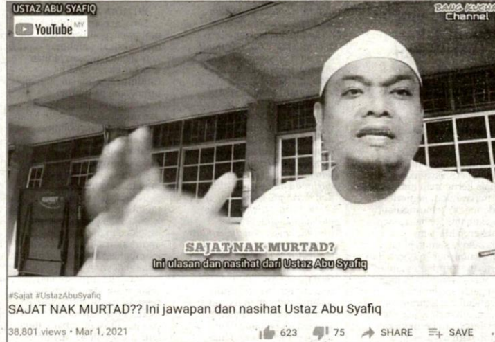
BERFAEDAHKAH para ustaz memuat naik video dalam YouTube untuk memberi ceramah kepada lelaki yang mempunyai jiwa cenderung ke arah kewanitaannya? - BANG KUCHAI CHANNEL

Hasil kajian ahli sains terbabit yang berdasarkan hujah logik akal menarik untuk diteliti kerana turut